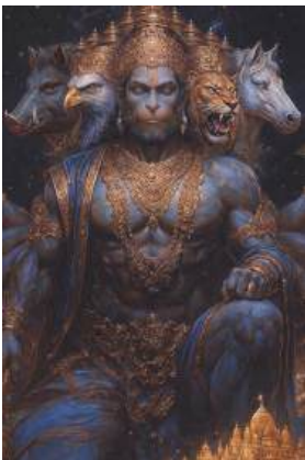
AI enhanced image.

3) अब हम उन दस वस्तुओं को समझेंगे जिन्हें प्रभु ने अपने दस हाथों में लिया हुआ है | ये इस कवच का बहुत महत्त्वपूर्ण भाग है | हर वस्तु एक प्रतीक है, प्रभु के काम करने के तरीके का | ध्यान से पढ़ें और अपने अंदर उतारें |