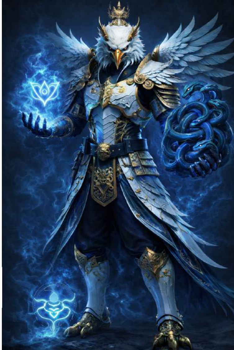
AI enhanced image.