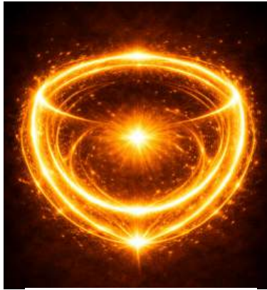
क्रूं कवचं - KROOM as Shield