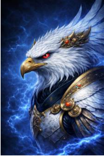
← गरुड़ मुख - पश्चिम Divine Eagle - West

This face is placed at the right side of the central, eastern face, symbolizing active protection (“right hand”). This principle works on threats requiring DIRECT confrontation - an enemy out in the open, dominating forces or deliberate injustice. Essentially, threats which are aggressive, violent and out of control - past the tolerance limits. Hence, a deliberate contrast between “being terrifying” and “destroying fear” is brought out - to show that such threats can only be removed by a power way greater than them.