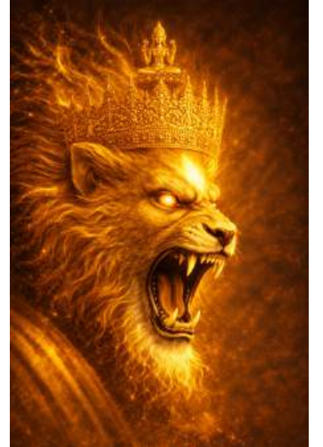
नारसिंह मुख - दक्षिण → Divine Lion - South