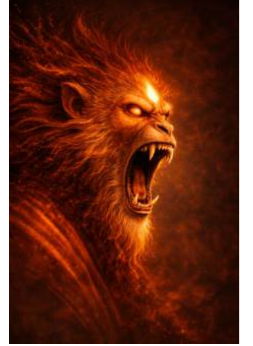
वानर मुख - पूर्व → Divine Monkey - East

AI enhanced image.