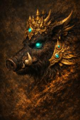
← सौकर मुख - उत्तर Divine Wild Boar - North

In this verse, the Garuda (Divine Eagle) principle is established as the western face of Panchamukhi Hanuman. This principle is not only powerful, but also extremely subtle and precise in terms of the method of operating. Lord Garuda is known as an antidote to poison, but here the scope is expanded to include spirit disturbances also. This is because both poison and spirit influences enter unnoticed, weaken life-energy from within, and cause damage by lingering where they do not belong. To counter these, more than an overwhelming force, a surgical force is needed. The Garuda principle does not bombard poison or spirits. It first severs their connection to us, and then, through its strength and radiance, relocates them to a place where they can no longer cause harm. The curved beak is not a physical trait. It is a symbol of focused and precise action. It pacifies Negative serpentine energies, and denotes a control on Kundalini related imbalances, ancestral nāaga related complications, and subterranean forces.