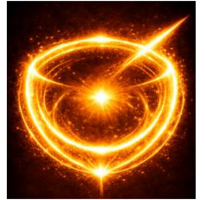
क्रैं अस्त्राय फट् - KRAIM as Strike NOW

Kraum Keelakam | Kroom Kavacham | Kraim Astraaya Phat - Hreem and Shreem have prepared us internally . We now need to give external direction to the energy. This is done by using Kraum, Kroom and Kraim . Please refer to the diagrams as you read.