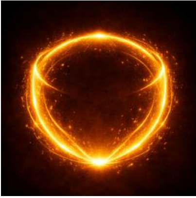
क्रौं कीलकं - KRAUM as Anchor

क्रैं कवच की प्रहार शक्ति से जुड़ा हुआ है | क्रैं के माध्यम से हम यह संकल्प घोषित करते हैं कि हमारी ओर आने वाले किसी भी खतरे या हमले पर ऊर्जा का सटीक और शक्तिशाली प्रहार किया जाएगा | यह ऊर्जा वही ऊर्जा है जो यह कवच निर्मित करेगा | इसलिए क्रैं के साथ हम “अस्त्राय फट्” कह रहे हैं, जहाँ अस्त्र मतलब हथियार और फट् मतलब “अभी” | ये एक निर्देश है - “इस कवच के द्वारा, हमें बचाने के साथ - साथ, आने वाले खतरे पर अस्त्र प्रहार भी तत्काल किया जाएगा” |