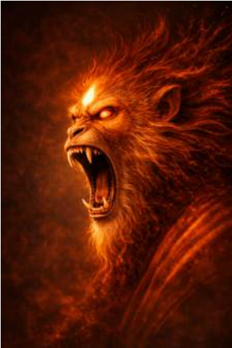
← वानर मुख - पूर्व Divine Monkey - East

Since its mode of working is cutting entanglements at their origin, this principle is aligned with North , the direction of stillness, depth, and ascent through stability. The north direction governs re-establishment of order, ensuring that once disturbances are removed, there is continuous stability. Hence, Divine Wild Boar in the North stands as the Guardian of deep equilibrium - slow, immense, and unwavering. It restores the positive forces within us which got “buried” and neutralises the negative forces.