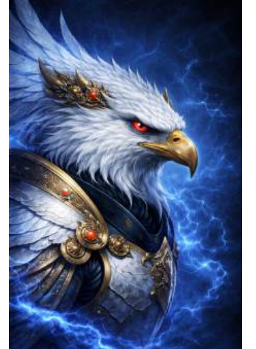
गरुड़ मुख - पश्चिम → Divine Eagle - West