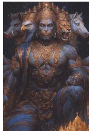
AI enhanced image.

3) We will now understand the 10 objects held by the Lord in His 10 hands. This is a very critical part of the Armour-text. Each object represents a specific function through which the Lord operates. Please read and absorb carefully.